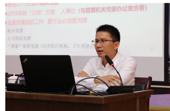
■ 文 / 张蓝溪 图 / 翁伟霖

据悉，根据《广东省加强党的基层组织建设三年行动计划（2018-2020年）》、《中共广东省卫生计生委党组印发〈广东省卫生计生委关于开展模范机关创建活动的工作方案〉的通知》要求，广东省人民医院就落实省卫生计生委创建模范机关工作制订了具体可行的实施方案，并分阶段、有重点地逐步推进。此次培训就是落实此项工作的重要举措。