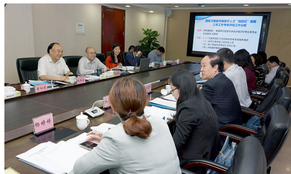
用大爱将西藏、新疆变成医务人员的精神家园。

第三，创新性开展“柔性援藏，志愿者在行动”，展现雪域高原上的黄马甲风采。该活动是利用我院在职和退休医务人员的业余时间，以志愿者的身份、穿着黄马甲去援藏、援疆，为当地医生授课、去会诊做手术，通过柔性援藏援疆活动，充分响应总书记的治边稳藏战略思想，