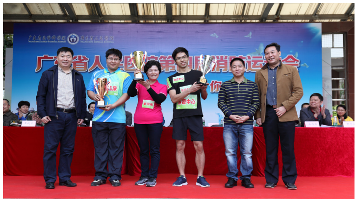
老研所、肿瘤中心、综合临床分别获得团体总分前三名

11月26日，我院在广州市第16中学运动场隆重举办广东省人民医院第四届消防运动会。冷空气还在徘徊，但依然挡不住职工参与的热情，经过紧张激烈的角逐，本次运动会共产生10个项目的冠军。其中老研所、肿瘤中心、综合临床分别获得团体总分前三名。