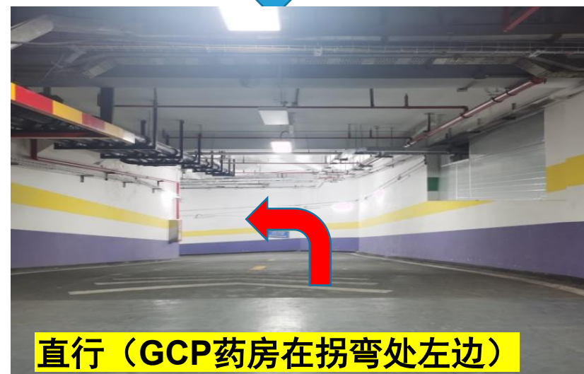
直行（GCP药房在拐弯处左边）