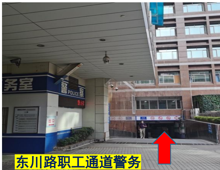
东川路职工通道警务室旁进入斜坡